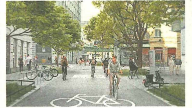
Die Pfeilgasse wird umfassend erneuert.