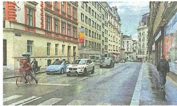
Wie soll die Gumpendorfer Straße künftig aussehen?